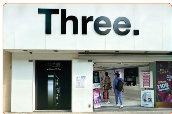
■ 3澳門致力持續提升網絡表現和客戶體驗。

3澳門致力持續提升網絡表現及客戶體驗，為應對客戶對可靠穩定的流動數據服務日增的需求，致力提升網絡覆蓋，例如為主要流動網絡提供雙重保護。集團於2021年在澳門推出的SoSIM預付SIM卡大受歡迎，並於全澳逾20家屈臣氏及百佳超級市場銷售，以滿足疫情後經濟及旅遊業復甦所帶動的增長需求。