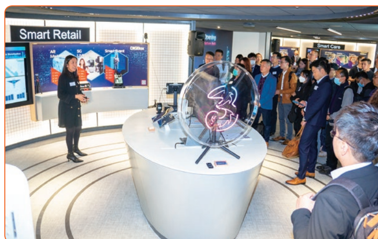
■ 集團的5G應用方案展覽館DIGIBOX協助企業數碼轉型，並推動智慧城市的可持續發展。

集團亦於2023年進一步拓展與固網營辦商的策略合作，透過整合資訊與通訊技術服務與固網電訊方案，達至固網及流動通訊滙流的協同效應，迎合企業市場不斷增長的需求。