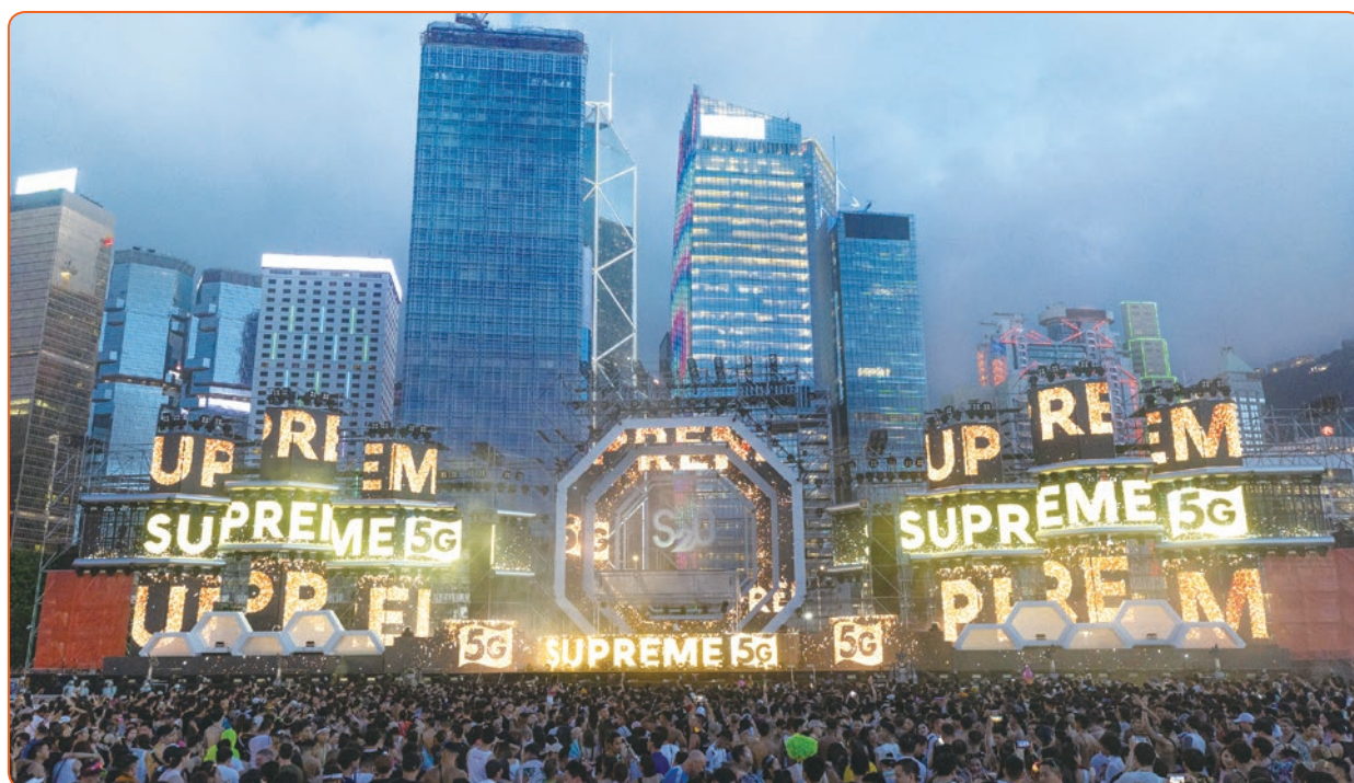
● SUPREME 擔任全球最大型潑水音樂派對「S20亞洲音樂潑水節 - 香港站」的大會5G贊助夥伴，為整個會場提供高速5G服務。