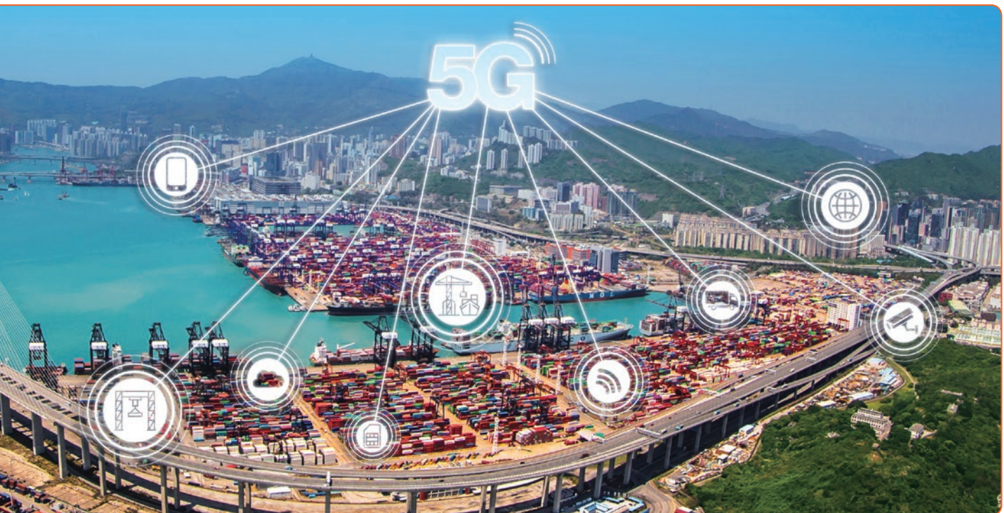
■ 集團於和記港口信託在香港的碼頭設置5G基站，讓其成為全港首個以5G營運的貨櫃碼頭。

集團嶄新的5G創新方案還包括5G智慧機械人，能有效於密閉空間尤其是隧道進行監測。憑藉集團穩健的5G網絡，機械人能傳送實時影像，無間監測隧道狀況。一旦出現任何異常情況，例如有有害氣體