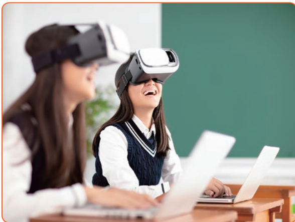
■ 一系列為學校和教育界而設的5G方案，有助建設智慧校園和提升智慧教育。

集團亦致力在教育範疇開發5G應用的龐大潛力，本年夏季成功於香港西班牙學校建構整個校園的5G流動網絡覆蓋，令該校成為香港首家採用5G技術打造智慧校園的國際學校之一。