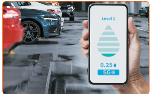
■ 集團有見2023年因極端天氣而發生水浸事件，推出5G智慧停車場水浸偵測方案。

集團因應2023年因極端天氣而頻繁發生的水浸事件，推出5G智慧停車場水浸偵測方案，根據各個停車場的特性度身設計，提醒用戶採取預防措施，幫助減低氣候變化帶來的相關影響。