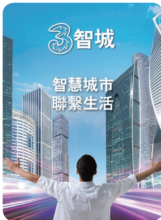
● 3 香港支持「 3 智城」項目，讓參與公司及科研專才盡享窄頻物聯網網絡的各種裨益。

於二〇一八年， 3 香港舉辦「香港智慧企業數碼峰會」，峰會的主題為「數碼轉型及智慧城市發展」，一眾來自不同商業界別的行政人員及業界領袖，在活動上交流有關部署物聯網及大數據方案的心得及經驗。