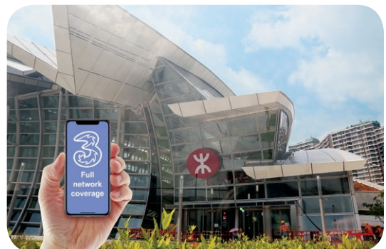
● 3香港迅速完成鋪設廣深港高鐵香港段的網絡，以便隨時為旅客提供高速的流動通訊服務。