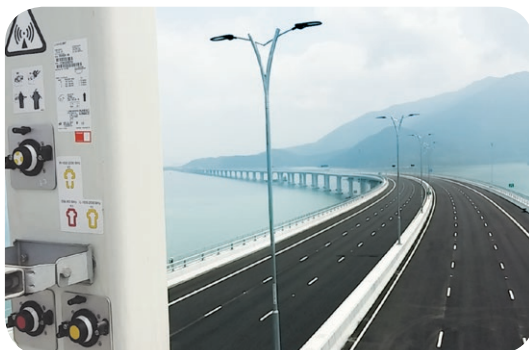
● 3香港率先宣佈開通港珠澳大橋香港段的4.5G網絡。

於二〇一八年，3香港與一家本地金融科技先鋒攜手推出3Money「新機•現金雙享計劃」。3香港客戶以