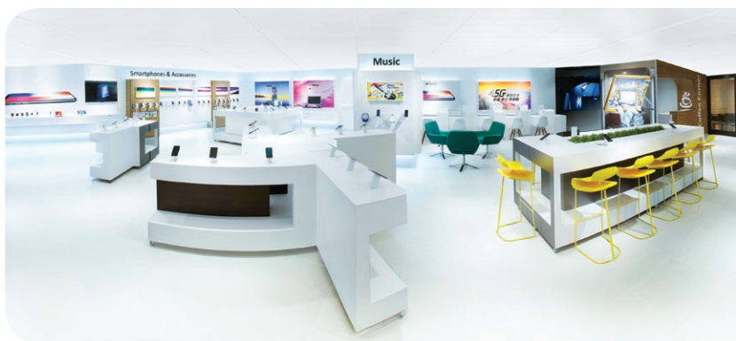
● 3LIVE 旗艦店為客戶提供多元化的通訊產品及服務。

3香港提供尖端的數據、話音及漫遊服務，以及拓展至全港各處，並隨時可供商業應用的窄頻物聯網網絡。集團利用全球生態系統，為家居、城市以及各