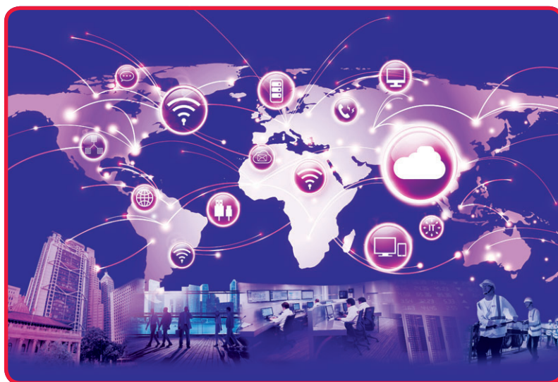
和記環球電訊提供一系列全面服務，於香港建構廿載。

在橫向發展方面，和記環球電訊的業務覆蓋於二〇一五年拓展至更多專門市場。大湄公河次區域仍然是和記環球電訊聚焦發展的專門市場之一，和記環球電訊透過在當地提