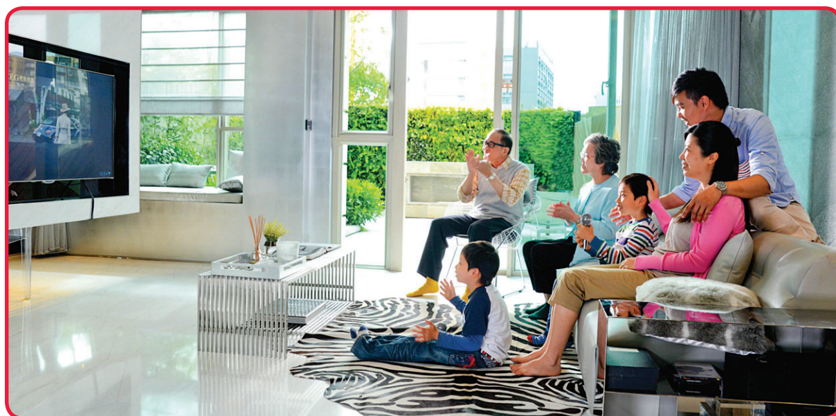
更多3家居寬頻客戶選用1Gbps「光纖到戶」服務。