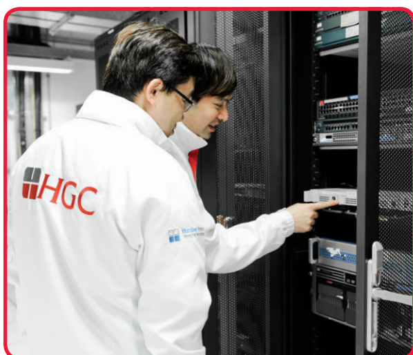
和記環球電訊數據中心為各行各業提供世界級的設施及服務。

和記環球電訊數據中心於二〇一五年獲「最佳數據中心」榮譽，彰顯業界對其環保設施的認同。和記環球電訊數據中心位於葵涌的數據中心已獲ISO 50001能源管理系統認證。我們所採取的能源管理措施，令和記環球電訊數據中心成為可持續發展的新一代綠色數據中心。