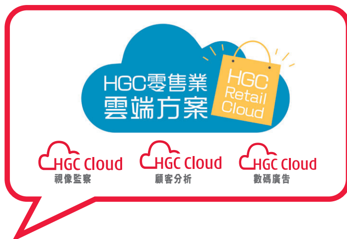
和記環球電訊的零售業雲端方案，有助零售商戶提升銷售及市場推廣效率。

和記環球電訊在提供基幹服務方面，於香港市場居領導地位。4G服務出現，市場為更快速傳輸數據，對高頻寬的需求大增；和記環球電訊遂推出千兆網絡連接服務應對，讓流動網絡營辦商作基幹用途的流動通訊基站可達每基站1Gbps的頻寬。