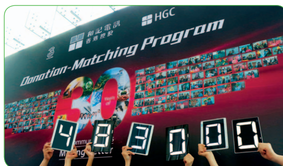
公司成立三十週年，舉辦籌款活動，為八家慈善機構籌得48.3萬港元善款。

等額配對捐款活動於二〇一四年十月分兩個階段舉行，集團鼓勵員工捐款，員工每捐出一元，集團亦會等額配對捐出一元。各部門的員工均騰出午膳時間以呼籲同事捐款及收集善款。善款已平均捐予八家非牟利慈善機構，包括香港展能藝術會、關心您的心、環保生態協會、福慧教育基金會、盈愛行動、香港唐氏綜合症協會、香港盲人輔導會及兩地一心。