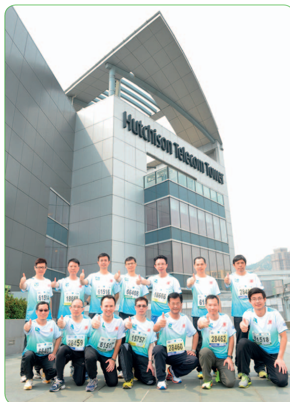
集團鼓勵員工參與有益身心的活動，平衡工作與生活。

事處更駐有指定急救人員，為有需要人士候命。我們亦提供職業健康及安全資源。事實上，集團於設計、營運及保養維修旗下業務設施時，均會考慮僱員的健康及安全。