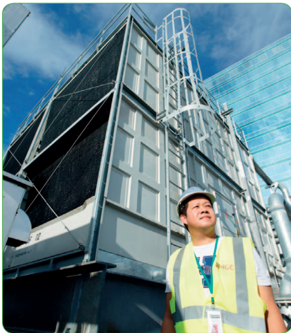
和記環球電訊數據中心的動力冷卻管理系統，減低空調的能源消耗。

我們於二〇一四年打造綠色數據中心，位於葵涌的設施通過ISO 50001 能源管理系統認證，證明我們在節能方面領先同儕，並致力以可持續方式發展數據中心設施。