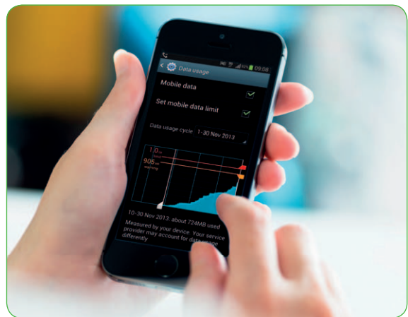
我們致力協助客戶瞭解其數據使用習慣。

確保顧客滿意我們的產品和服務是集團的重要任務。我們致力確保集團遵守其業務所在司法權區內的各項法規。集團的操守守則要求員工遵守適用的政府及監管法律、規則、守則及規例。