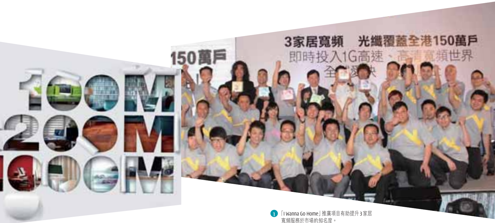
1 「I Wanna Go Home」推廣項目有助提升3家居寬頻服務於市場的知名度。

年內，我們於本地寬頻市場乘勢推出3家居寬頻「I Wanna Go Home」大型推廣項目，為客戶提供耳目一新、多姿多彩的上網體驗。是項宣傳攻勢，配合擴展後的分銷網絡和3Home-Runner專業安裝團隊，有助提升3家居寬頻在本地市場的品牌認受性。