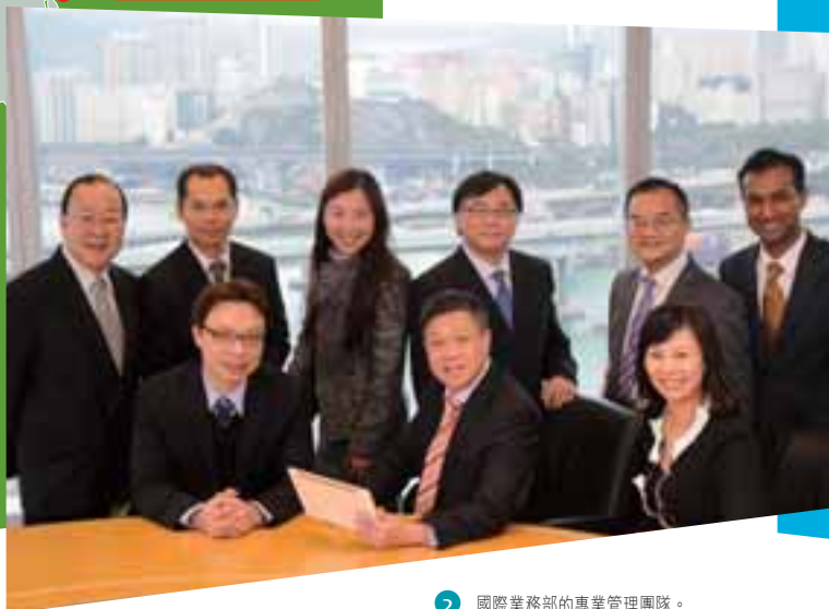
2 國際業務部的專業管理團隊。