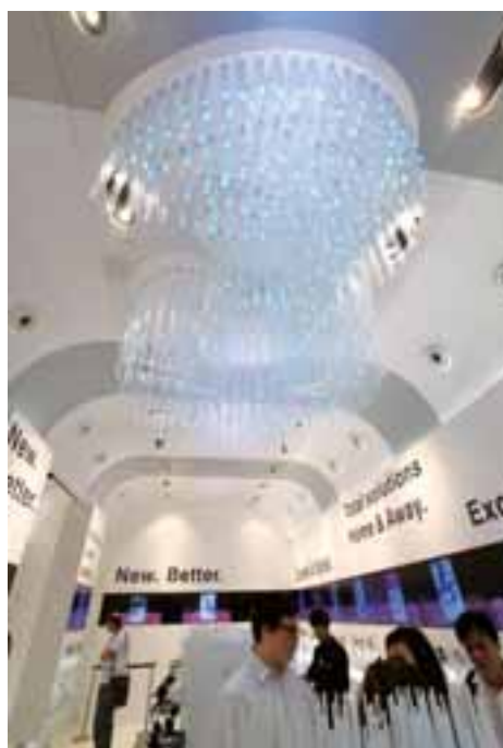
• 逾200間3品牌店舖及分銷點為客戶提供一站式電訊服務

隨著我們強勢結合固網與流動通訊，迅速成為客戶認識的「3寬頻無限」品牌，成功在銷售方面取得協同效應，例如我們的固網直銷團隊現可為客戶推廣固網與流動通訊的組合計劃。