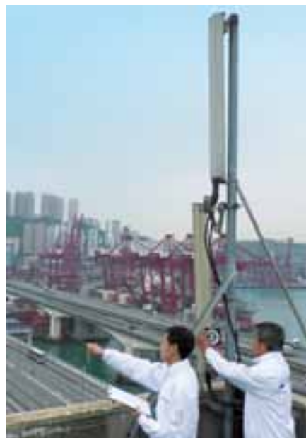
• 3致力為客戶不斷擴展流動網絡覆蓋範圍