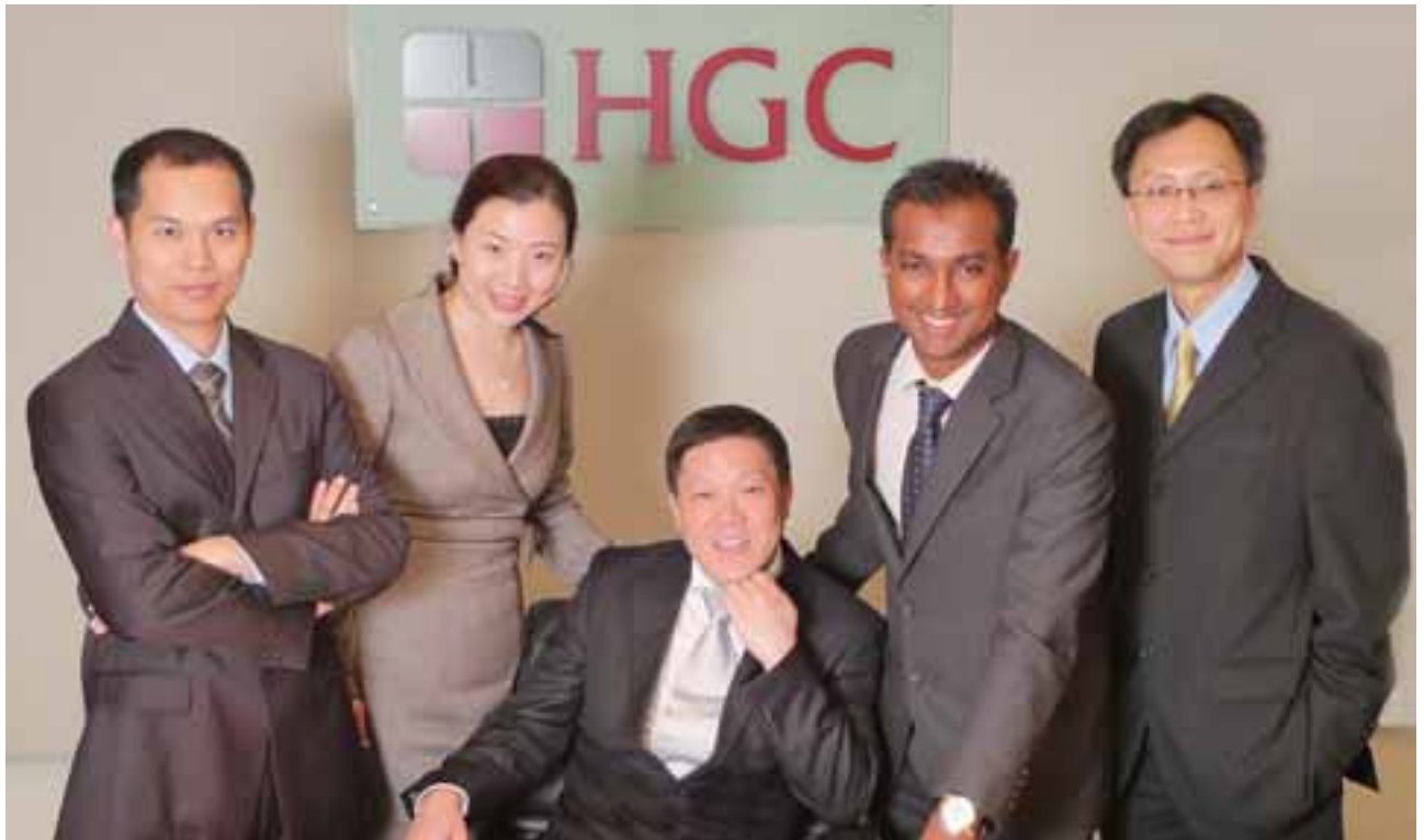
• 國際業務部的專業管理團隊

我們投資於橫跨亞洲、太平洋及大西洋地區的多個海底電纜系統，並以SDH、以太網及wavelength為基礎的平台，提供達網絡商級別之數千兆的網絡商連接方案。此外，區內具領先地位的互聯網服務供應商及網絡商亦採用和記環球電訊穩健的互聯網骨幹，以滿足其國內迅速增長的頻寬需求。