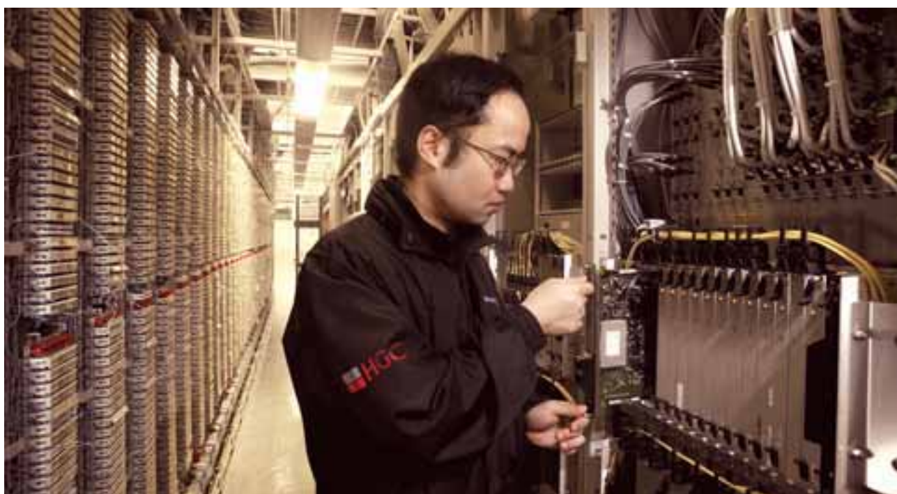
• 和記環球電訊經營國際級的電訊網絡基建及設施