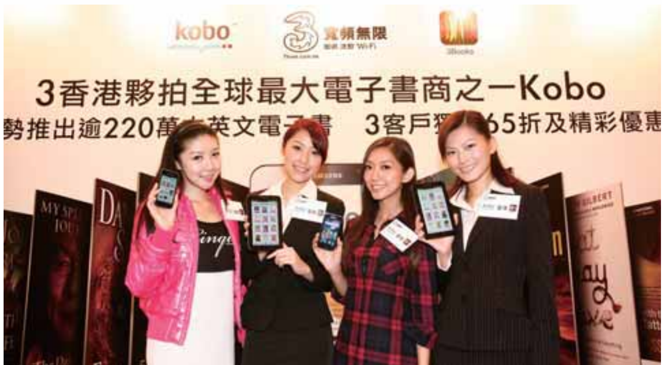
• 3香港獨家夥拍Kobo Inc.，為客戶帶來全新的電子書閱讀樂趣

我們早著先機，領先市場，全力為高回報的數據用戶提供切合所需的流動通訊服務，此舉讓我們對這不斷增長的市場有更深入的認識，同時亦能把握最大的商機，設計創新的增值服務，並提升客戶的忠誠度。