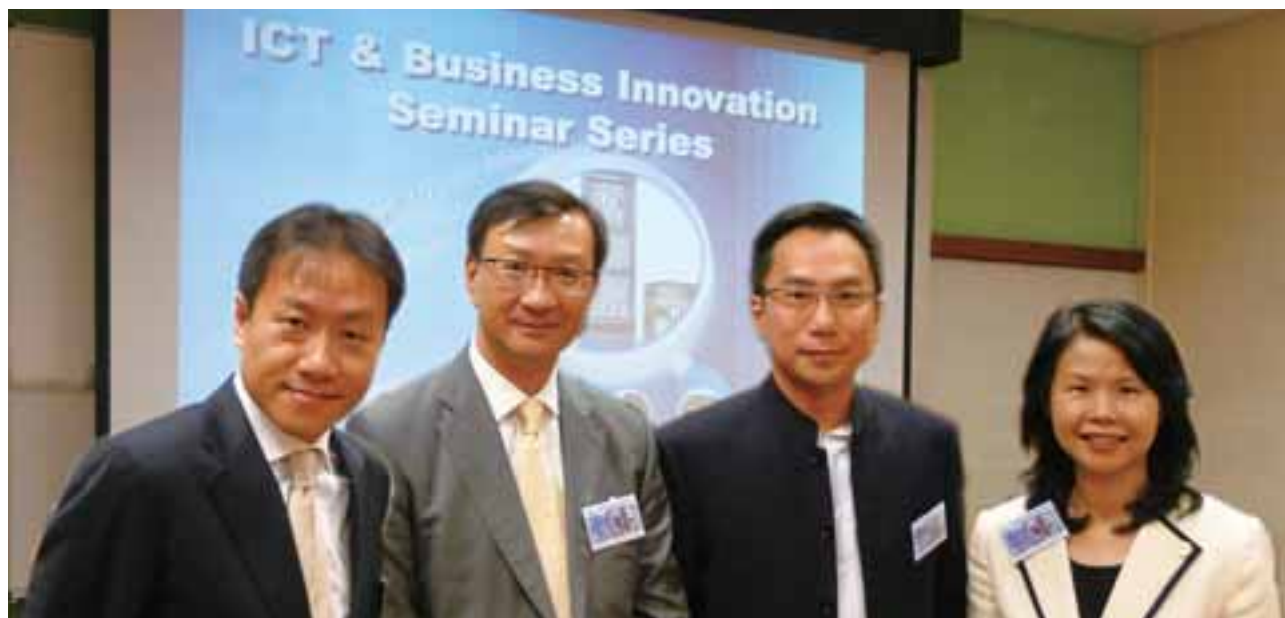
• 和記環球電訊於業界座談會積極推動意見交流