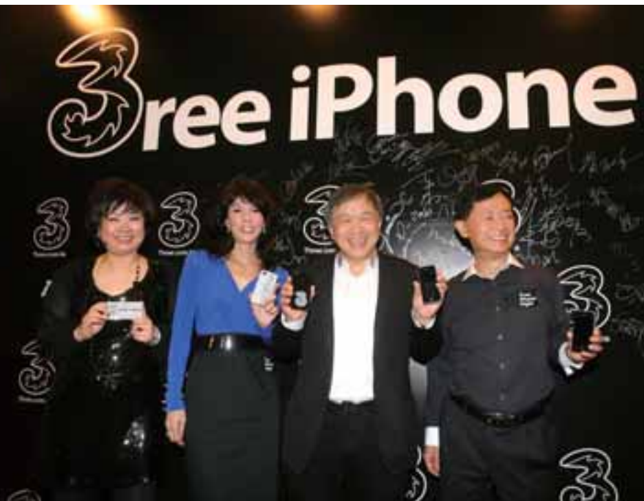
• 3 香港舉辦的“iPhone Night”全城矚目