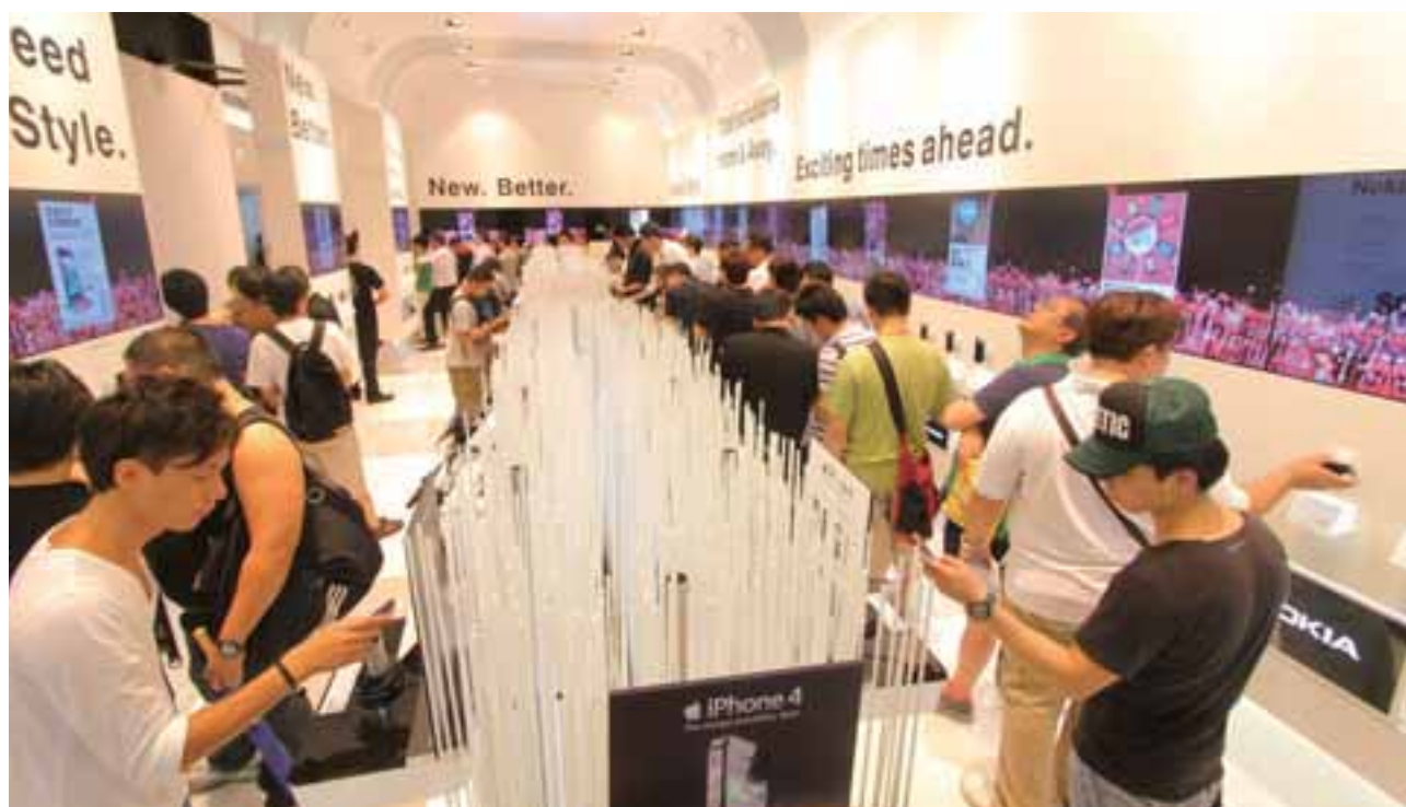
• 位於中區的3概念店揉合時尚設計與科技