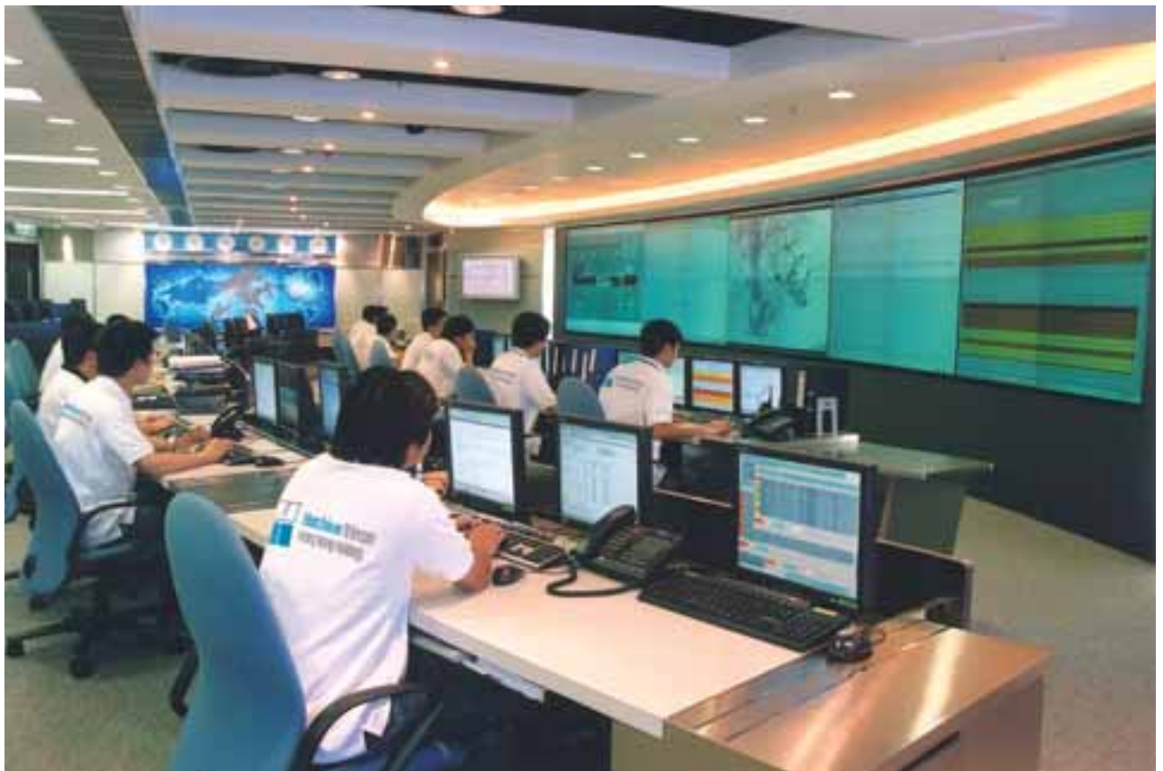
● 3 香港的中央網絡營運中心確保流動網絡表現達至最高水平

隨著香港固網及流動通訊領域中高數據用量服務邁向另一新紀元，集團處於極具優勢的位置，在需求不斷提高的商業及消費市場擔當領導角色。此優勢主要來自我們持續為基礎設施進行提升及強化工程，以及採用尖端技術所帶來的創新應用程式。憑藉先進的綜合網絡，以及有效提升用戶忠誠度及客戶服務延續措施等全方位優質服務水平，我們為客戶提供無可比擬的體驗，帶動用戶大幅增長。