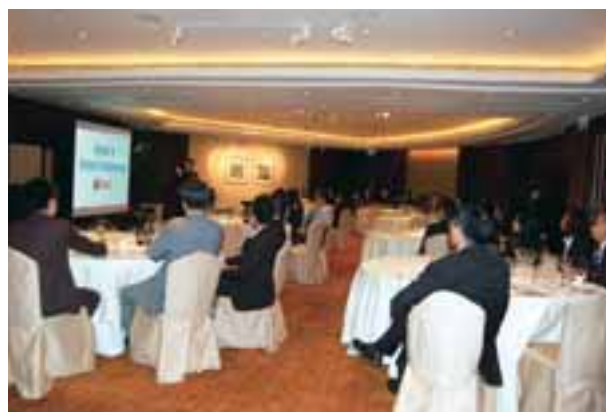
• 和記環球電訊致力為企業客戶提供最先進的電訊方案

我們是首家互聯網服務供應商，透過安裝光纖網絡，為中、小學校及大專學府提供高速及對稱的寬頻服務，自二〇〇三年以來一直穩佔最大的市場佔有率。我們除為