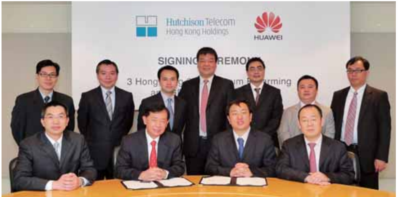
• 本公司委任華為展開網絡提升工程