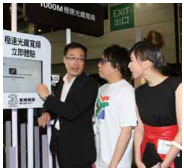
• 3 寬頻無限帶領客戶進入高達 1,000Mbps 的極速光纖寬頻通訊新紀元

和記環球電訊營運的光芯總長逾一百萬公里，網絡光纖管道長約六千公里。現時我們為本港唯一網絡營辦商提供連接至中國內地的陸地電纜。旗下合共四條陸地電纜現已於文錦渡、羅湖、落馬洲及深港西部通道投入服務。