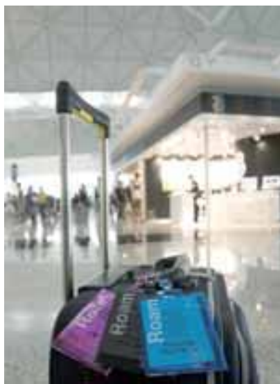
• 3香港為旅客帶來無憂的國際漫遊體驗

此外，Be3ree智能手機優惠平台更獨家為客戶提供全天候的3Screen嘉禾戲院全年通行證，客戶逢星期三可在指定的戲院免費欣賞喜愛的電影。