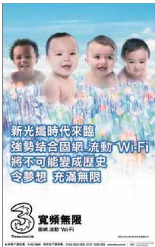
• 3寬頻無限品牌匯合流動通訊、家居固網及Wi-Fi服務，帶領電訊業邁向固網及流動通訊匯流新紀元