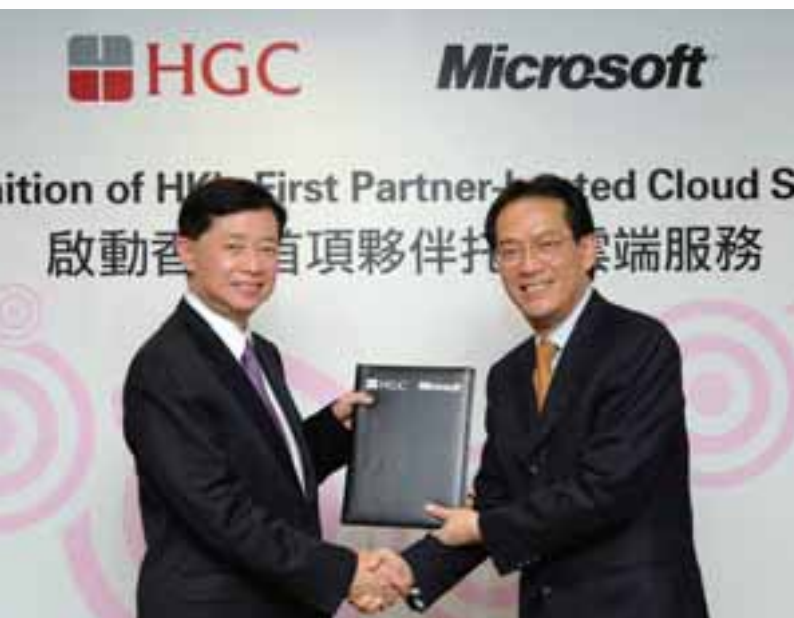
• 和記環球電訊與Microsoft Hong Kong 攜手為本地企業提供卓越的雲端服務