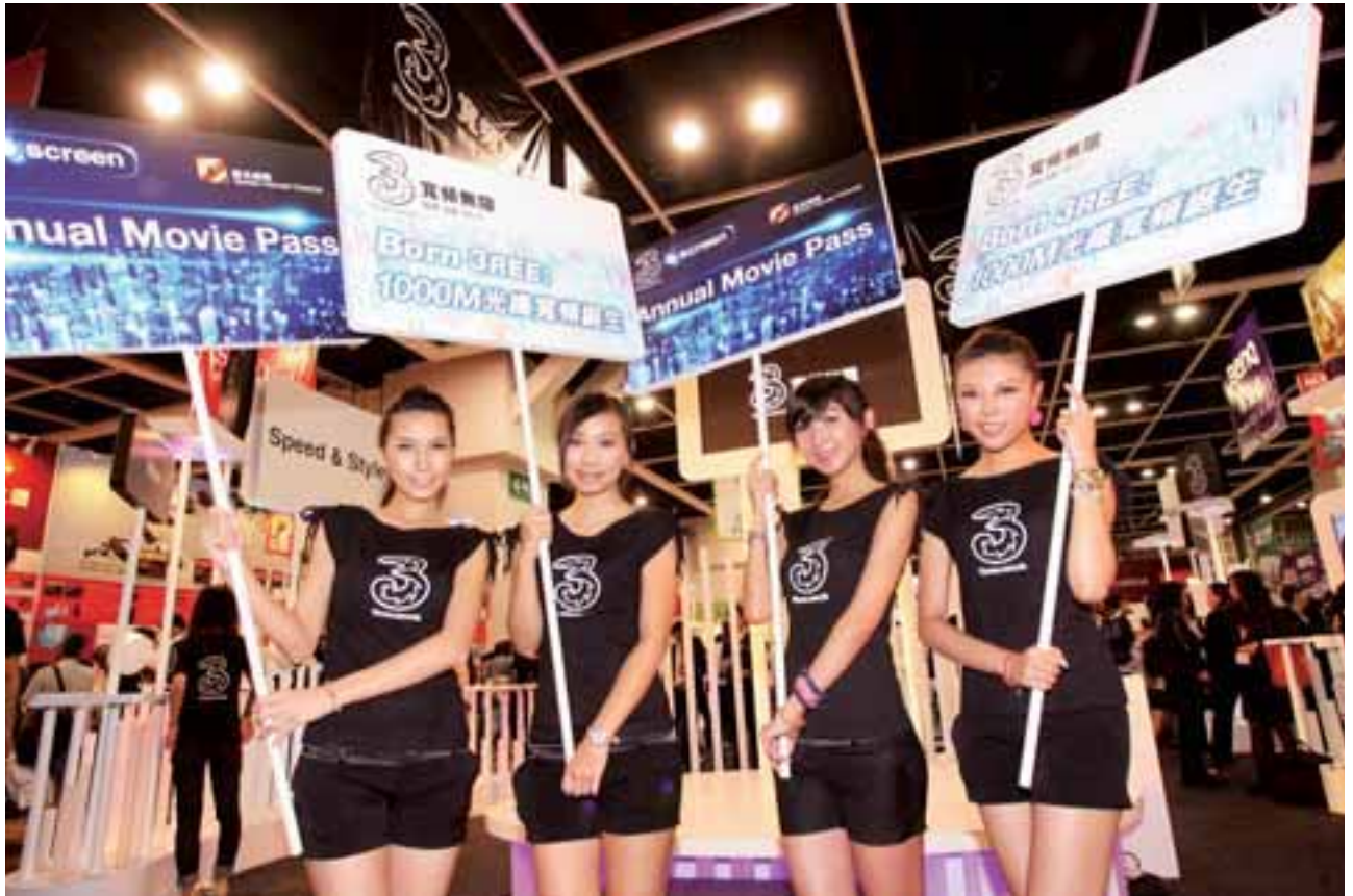
• 3 寬頻無限推出 1,000Mbps 家居寬頻服務