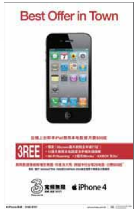
• 3 香港 iPhone4 的銷售推廣活動

香港雖被視為全球其中一個競爭最激烈的流動通訊市場，3 品牌依然在市場保持領先地位，並勢將邁向澳門市場的領導位置。集團取得成功，全賴 3 在以數據為主的流動通訊用戶羣中所建立的首選品牌形象。